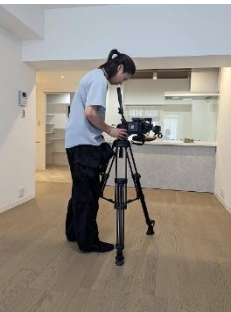
真剣にカメラの調整をする笑顔が素敵なスタッフさん

今やSNSは生活に欠かせない存在となっていますが、弊社も時代の波に遅れないよう、お客様にもっと弊社の作り上げるこだわりのお部屋を見ていただく「ルームツアー動画」を作成中です。今後弊社HP、インスタ、youtubeのショート動画などで配信予定です。また7、8月はお部屋検索サイトathomeで豊橋市と岡崎市の『中古マンション』を検索された方に弊社の広告が表示されるようになります。