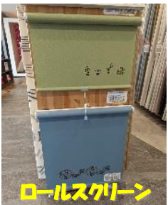
ロールスクリーン