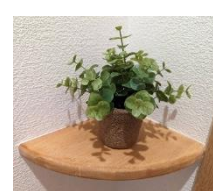
トイレの一角ですが緑を飾ったりスマホの一時置き場としても活躍しますよ!