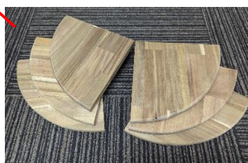
壁のコーナーに使える棚板

DIY収納で使った棚板が変身! 昨年の6月に掲載した我が家の台所収納のDIY工事の続編の記事にさせて頂きました。ホームセンターで購入した積層材ですが、残った廃棄材料をなかなか処分できずいたので、「捨てるよりは活かす」事を考え、今回見事に蘇りました。一部はコーナー飾り棚として、後はリフォーム現場に活用していいと思います。